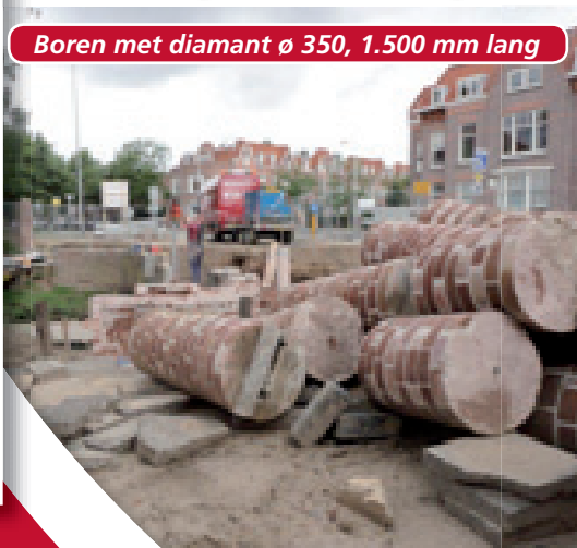
Boren met diamant ø 350, 1.500 mm lang