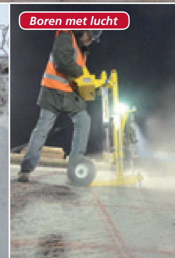
Boren met lucht