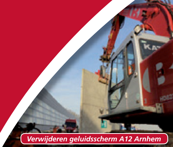
Verwijderen geluidsscherm A12 Arnhem