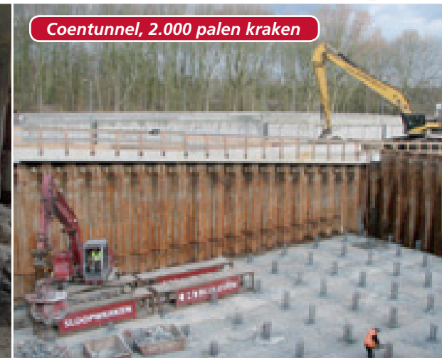
Coentunnel, 2.000 palen kraken